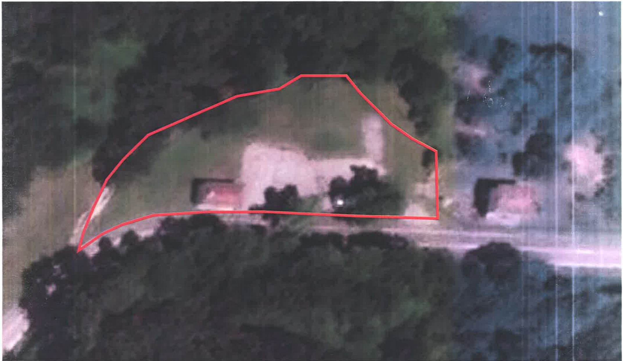
CUERPO DE TÉCNICOS SUPERIORES: ARQUITECTOS SEGUNDO EJERCICIO IMAGEN AÉREA E:1/500